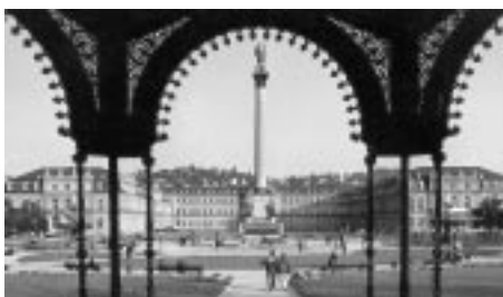
Blick auf die mächtige Drei-Flügel-Anlage des Neuen Schloss in Stuttgart (erbaut im 18. Jhd.; wiederaufgeb. um 1960)

gelände auf dem Killesberg, die Neue Staatsgalerie und das Gottlieb-Daimler-Stadion. Bosch, Mercedes und Porsche sind nur drei Namen von vielen Firmen, die dort ansässig 14 sind. Der