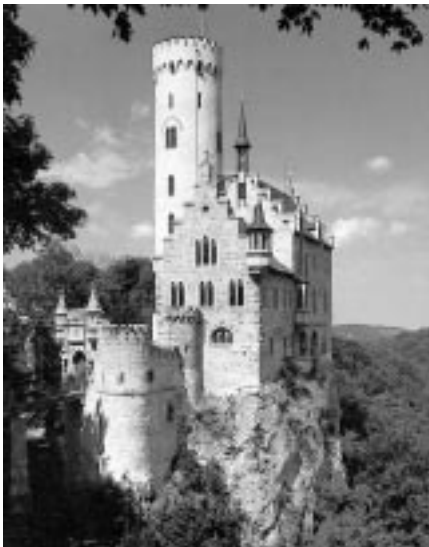
Das Schloss Lichtenstein auf der Schwäbischen Alb

Heute überfliegen wir wieder einmal gemeinsam ein deutsches Bundesland: Baden-Württemberg 1 , dass in diesem Jahr 50 Jahre alt wird. Wir starten vom Flughafen südlich der Landeshauptstadt Stuttgart. Zuerst fliegen wir einige Minuten Richtung Osten. Bald glitzert 2 unter uns das Wasser des Neckar, dessen Lauf wir einige Minuten lang folgen. Dieser ca. 370 km lange Fluss kommt von Süden her und trennt mit seinem Tal den berühmten Schwarzwald im Westen von der Schwäbischen Alb (1015 m), die