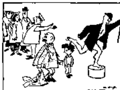
Aus: o.g.lawen, „Vater und Sohn“, Gesamtausgabe © Städeling GmbH, Konstanz, 1982 (neu) mit Genehmigung der Gesellschaft für Verlagswesen GmbH, Konstanz (Schweiz).

Liebe Leser, hier ist wieder unsere Briefkontaktscke mit einem Teil der uns vorliegenden Adressen. Da wir viele Anfragen vorliegen haben, kann es etwas dauern, bis Ihre Adresse erscheint. Geben Sie bitte immer Ihr Alter an! Da wir hier hauptsächlich Leseradressen veröffentlichen, haben wir leider nur sehr selten Adressen aus Deutschland vorliegen. Wir bitten darum um Ihr Verständnis!